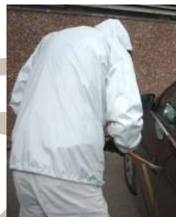
Trenden viser at eldre biler uten startspærre og alarm er et yndet tyveriobjekt.

If har i flere år stilt krav til sporingssystemer i kjøretøy som er spesielt utsatt for tyveri. En fastmontert boks i kjøretøyet sender signaler til en vaktentral om at bilen beveger seg. En SMS-melding overføres til bileieren som bekrefter at kjøretøyet er stjålet. Deretter aksjonerer vaktentralen og lokaliserer kjøretøyet der det befinner seg. Det finnes flere alarm- og trackingsystemer på markedet. DEFA har godt innarbeidede sikkerhetsprodukter med høy kvalitet.